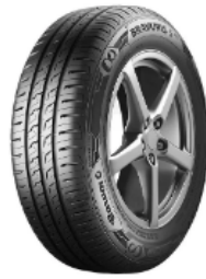
Pneu Barum Bravuris 5HM P 175/65R14 82 T