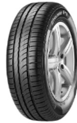
Pneu Pirelli Cinturato P1 P 175/65R14 82 T